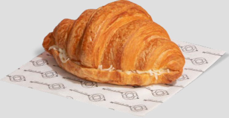
كروسان جبنة CHEESE CROISSANT 17SR | CAL. 210