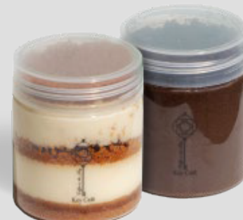
اوريو بودينغ / تشيز كيك OREO PUDDING CHEESE CAKE LOTUS 16SR | CAL. 160