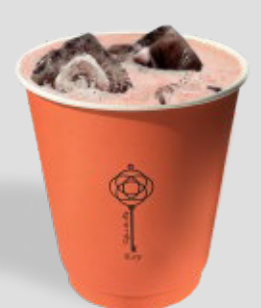
كركديه KARKADE 16 | CAL. 140