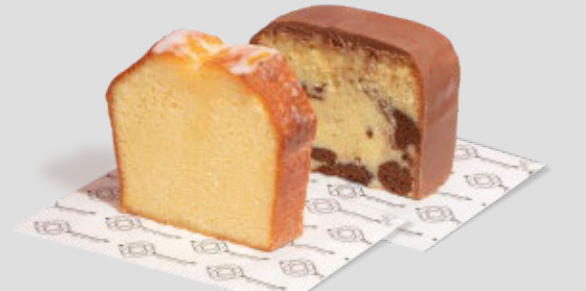
كيك انجليزي شوكولاتة / ليمون ENGLISH CAKE Chocolate / lemon 13SR | CAL. 430