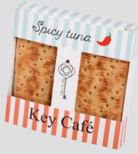
سبايسي تونة SPICY TUNA 19SR | CAL. 240