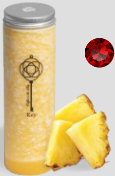
الأناناس PINEAPPLE 22 | CAL. 240