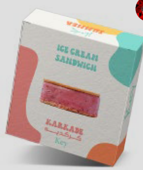
آيس كريم ساندوتش كركديه ICE CREAM SANDWICH Kakadeh 12SR