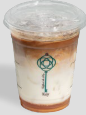
لاتيه كراميل مملح مثلجة ICED SALTED CARAMEL LATTE 25 | CAL. 220