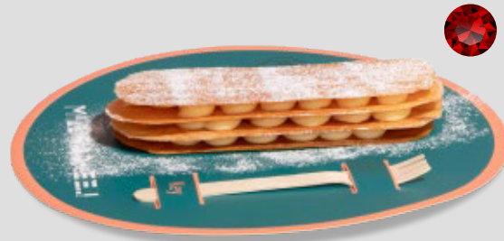
ميل فوي MILL-FOO 26SR | CAL. 210