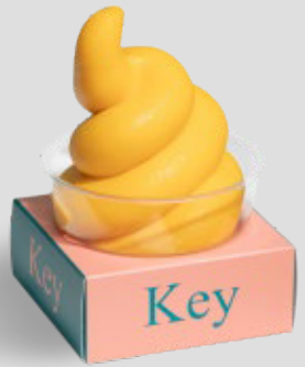
آيس كريم مانجو MANGO ICE CREAM 19SR | CAL. 100