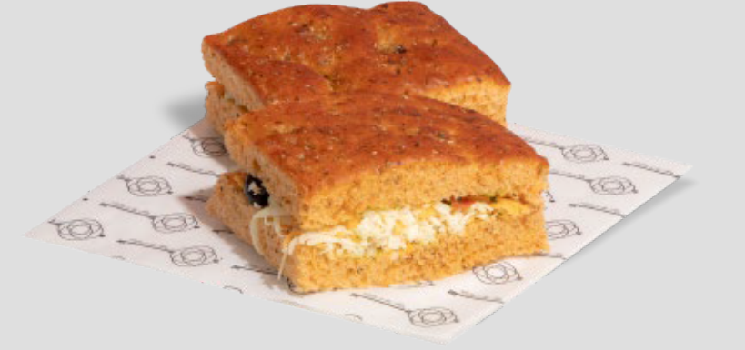
الأجبان الأربعة FOUR CHEESE SANDWICH 26SR | CAL. 340