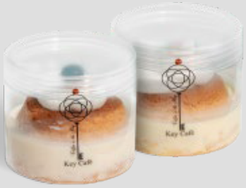
كيكة زعفران / حليب SAFFRON / MILK CAKE 35SR | CAL. 370