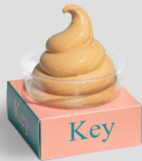
آيس كريم كراميل مملح SALTED CARAMEL ICE CREAM 19SR | CAL. 60