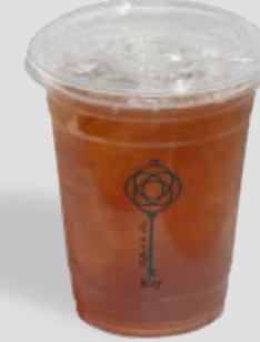
آيس تي خوخ PEACH ICED TEA 19 | CAL. 220