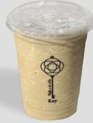
غرانيتا مثلجة ICED GRANITA 29 | CAL. 380