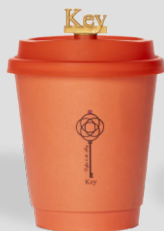
ESPRESSO 8 | CAL. 50 MACCHIATO 10 | CAL. 70 AMERICANO 13 | CAL. 120 FLAT WHITE 16 | CAL. 100 CAPPUCCINO 17 | CAL. 180 TEA RED / GREEN 9 | CAL. 50 LATTE 17 | CAL. 180 REDVELVET 19 | CAL. 290