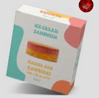
آيس كريم ساندوتش مانجو وتوت ICE CREAM SANDWICH Mango Raspberry 12SR