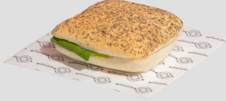
كابريزي ساندوتش CAPRESE SANDWICH 23SR | CAL. 255