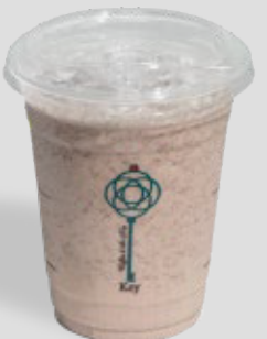
ميلك شيك أوريو MILKSHAKE OREO 27 | CAL. 150