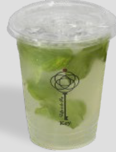
كي بريس KEY™ BREEZE 21 | CAL. 170