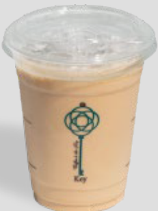
ميلك شيك لوتس MILKSHAKE LOTUS 27 | CAL. 150