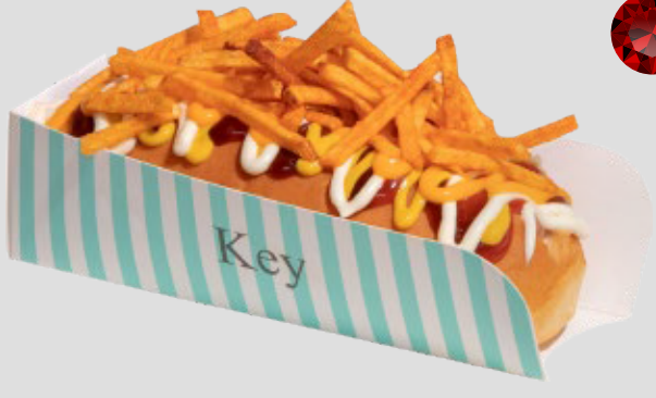
هوت دوغ HOT DOG 18SR | CAL. 350