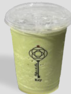
ماتشا بوراندو MATCHA BURENDO 29 | CAL. 380