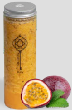
باشن فروت PASSION FRUIT 22 | CAL. 240