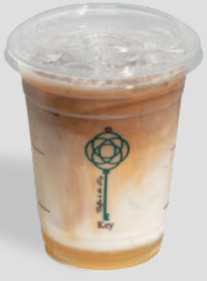
القهوة الاسبانية مثلجة ICED SPANISH LATTE 22 | CAL. 340