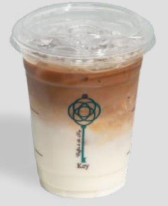
كافيه لاتيه مثلجة ICED CAFÉ LATTE 17 | CAL. 180