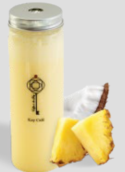
كي كولادا KEY COLADA 22 | CAL. 270