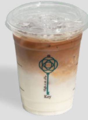
وايت موكا مثلجة ICED WHITE MOCHA 22 | CAL. 340