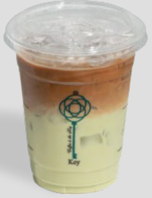
لاتيه الفستق مثلجة ICED PISTACHIO LATTE 27 | CAL. 323