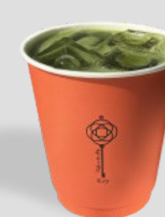
ماتشا مثلجة ICED MATCHA 24 | CAL. 120