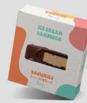
آيس كريم ساندوتش براونيز ICE CREAM SANDWICH Brownies 12SR