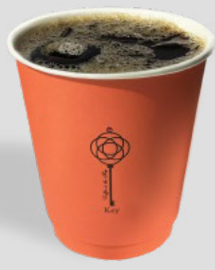
قهوة اليوم مثلجة ICED COFFEE OF THE DAY 8 | CAL. 120